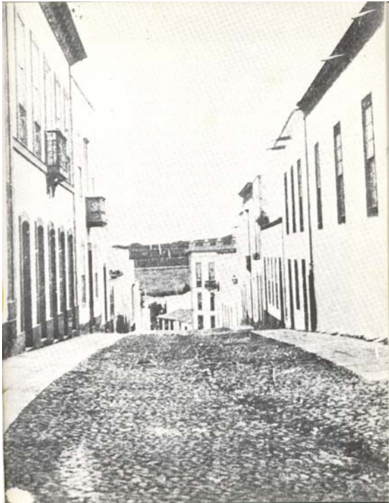
A la izquierda, foto de finales del siglo XIX calle Luján Pérez donde nació en 1913 Adela Escartín.