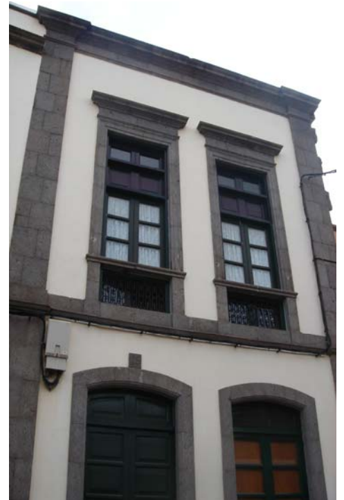
A la derecha, casa donde en el año 1917 estaba empadronada la familia Escartín Ayala, nº 23 hoy nº 25, por ser la casa de Emiliano Ayala Hernández (Foto tomada en 2007)