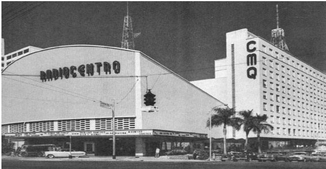
Foto de la Radio CMQ de La Habana (Cuba).

En 1952 regresa a La Habana (Cuba), donde ya había ido como actriz invitada en varias producciones teatrales. Desde 1952 a 1959 trabaja ininterrumpidamente como primera actriz en teatro, radio y televisión (actriz exclusiva de CMQ), en empresas privadas y en su propia Sala: Prado 260.