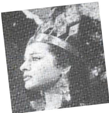
En ambas fotografías, podemos apreciar a Silvana Pampanini.

Pero junto a la lista de artistas más o menos famosos, también aparecían numerosos extras, lugar que fue ocupado por un amplio colectivo de gentes de Gran Canaria, y de otras islas, como es el caso del Pollo de Arrecife. Como es de suponer, el mayor número de anécdotas y recuerdos vienen de mano de estos isleños.